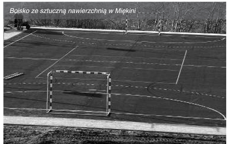
Boisko ze sztuczną nawierzchnią w Miękinii

Czy wybudowane w Miękinii i Lutyni boiska będą ogólnodostępne dla mieszkańców?