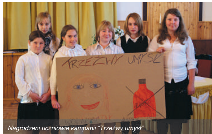
Nagrodzeni uczniowie kampanii „Trzeźwy umysł”

Gminny Koordynator kampanii raz jeszcze serdecznie dziękuje za wspaniałą zabawę i już dziś zaprasza na kolejną edycję w 2009 roku!