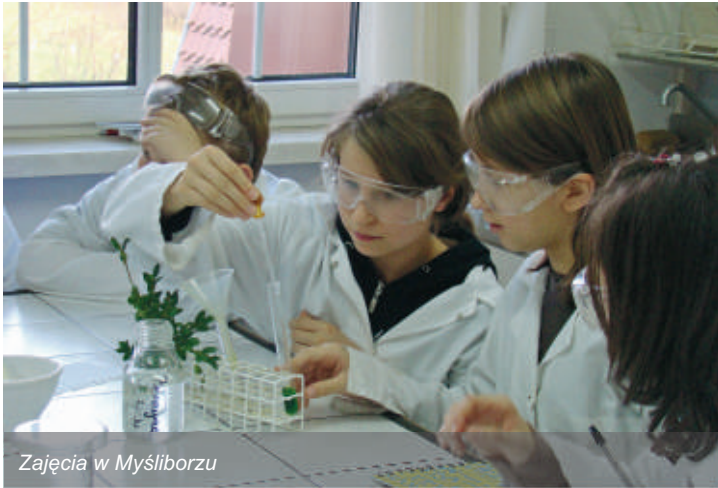
Zajęcia w Myślborzu

W listopadzie zakończył się projekt pn. „Program edukacji ekologicznej dla Gminy Miękinia etap II”. Projekt został dofinansowany z Wojewódzkiego Funduszu Ochrony Środowiska i Gospodarki Wodnej we Wrocławiu w kwocie 40 tys. zł. Łączny koszt projektu to kwota 64 386 zł.