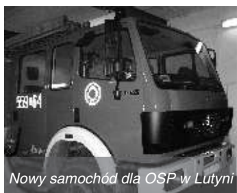
Nowy samochód dla OSP w Lutyni

Zakupiony nowy samochód wraz z wyposażeniem ułatwi strażakom wyjazd do pożarów. Jednostka OSP z Lutyni bierze udział w działaniach ratowniczych na terenie gminy Miękinia, powiatu średzkiego, a także w województwa dolnośląskiego.