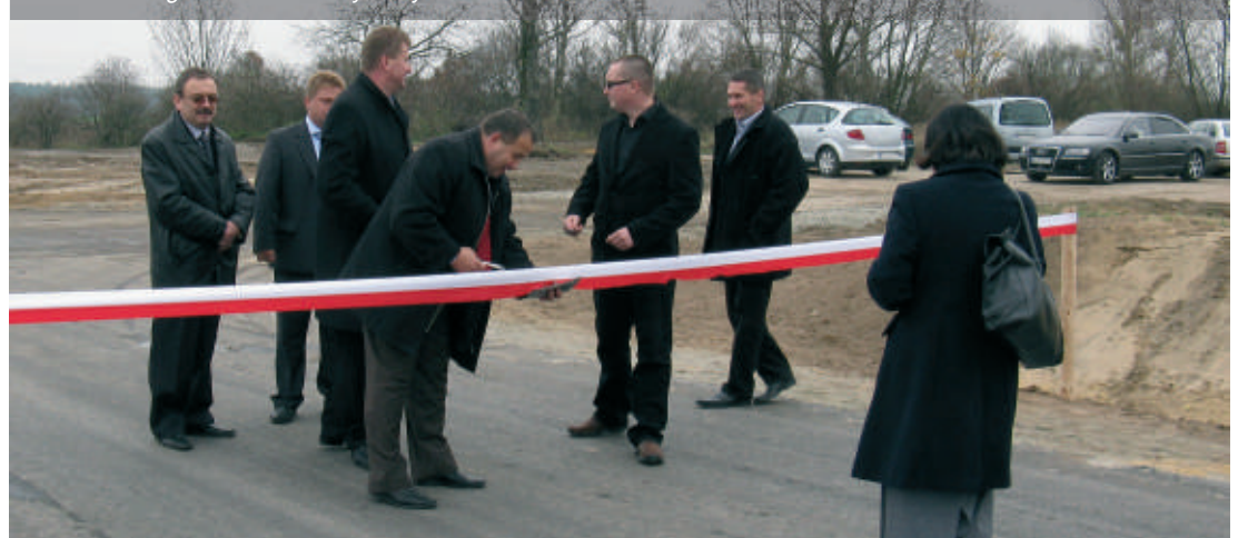
Otwarcie drogi w Parku Przemysłowym PA

przeznaczonych na utworzenie Parku, ma już swoje przeznaczenie, trwają mocno zaawansowane prace projektowe i przygotowawcze przed rozpoczęciem inwestycji. Dla wykorzystania reszty obszaru prowadzone są rozmowy z potencjalnymi inwestorami.