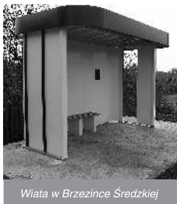
Wiaty w Brzezince Średzkiej

W miejscowości Wilkoszów, Brzezinka Średzka i Brzezina zostały zamontowane nowe wiaty przystankowe. Gmina na powyższy cel przeznaczyła 10 tys. zł., mając nadzieję, że posłużą one długo mieszkańcom wsi i nie zostaną zniszczone przez wandalów.