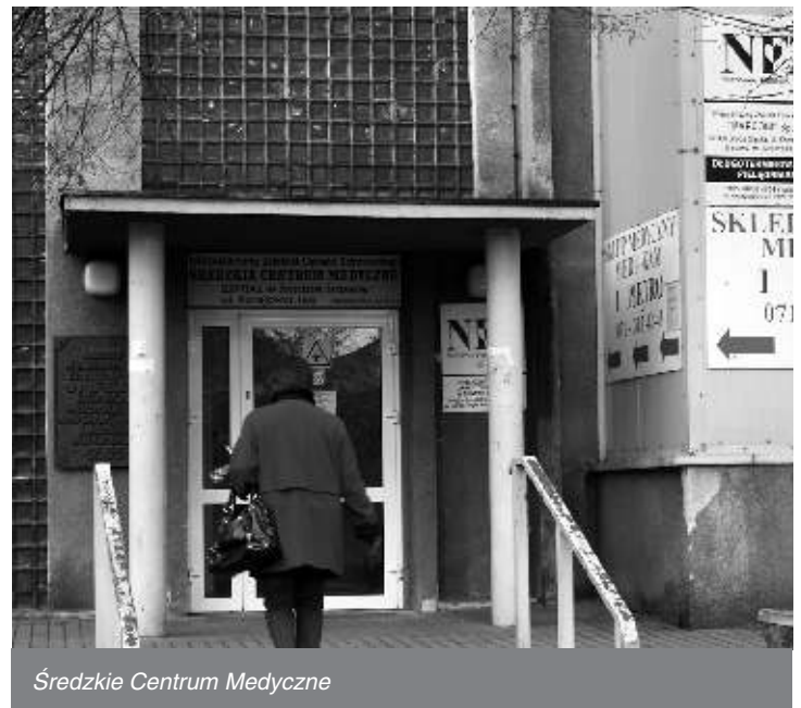
Średzkie Centrum Medyczne

W ramach pomocy dla średzkiego szpitala, Gmina Miękinia zakupi i przekaże na rzecz placówki nowy sprzęt medyczny. Będą to: wózki do przewożenia chorych, stół do opatrunków oraz pompy infuzyjne. Pompy infuzyjne stosowane są do ciągłego, dokładnego dawkowania leków głównie na oddziałach intensywnej terapii medycznej. Wartość sprzętu to kwota 45 tysięcy złotych. Wyposażenie zostanie przekazane do szpitala po przeprowadzeniu postępowania przetargowego na zakup wymienionego sprzętu.